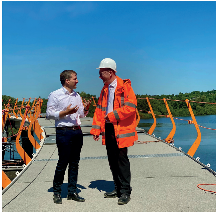
Machten sich ein Bild vom Baufortschritt der Radbrücke: Infrastrukturmater Christian Pegel (rechts) und Oberbürgermeister Rico Badenschier

Die Brücke sollte eigentlich schon im Sommer 2019 fertiggestellt sein. Jedoch wurde der Baubeginn u. a. durch rechtliche Auseinandersetzungen immer wieder verzögert. Die Argumente der Kläger waren dabei aus Sicht der Stadt offensichtlich fadenscheinig. Die Klage eines Anwohners wurde im September