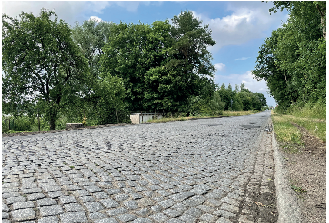
Ab dem 28. Juni 2021 geht der grundhafte Ausbau der Rogahner Straße weiter. Die Fertigstellung der Gesamtbaumaßnahme ist für Ende 2023 geplant.

„Der Ausbau der Rogahner Straße beschäftigt uns schon seit mehreren Jahren. Der nun in Angriff genommene Abschnitt vom Schulzenweg bis zum Obotritenring wurde durch ein Planfeststellungsverfahren begleitet und ist für die Landeshauptstadt das größte Straßenbauvorhaben des Jahres“, sagt Baudezernent Bernd Notbaum. Die Bauausführung erfolgt in zwei großen Teilabschnitten. Der erste erstreckt sich nach der Kreuzung Schulzenweg/Breite Straße (stadteinwärts) bis zur Brücke über den Verbindungsgraben vom oberen zum unteren Ostorfer See. Der zweite beginnt von der Brücke und endet an der Anbindung der Rogahner Straße an den Obotritenring. Die Straße ist dafür ab Montag, dem 28.06.2021 gesperrt. Eine Umleitung ist bereits vorbereitet. Der Verkehr wird dann über die Umgehungsstraße von der Ludwigsuster Chaussee und den Anbindungen Görries, Neumühle und Lärchenallee geführt. Für die Erreichbarkeit der am nördlichen Baufeld anliegenden Grundstücke und Kleingärten wird der parallel zur Bahnstrecke verlaufende Gartenweg zwischen Marienhöhe und Rogahner Straße, auf Höhe Möbelbörse, asphaltiert. Radfahrer können von Görries aus in