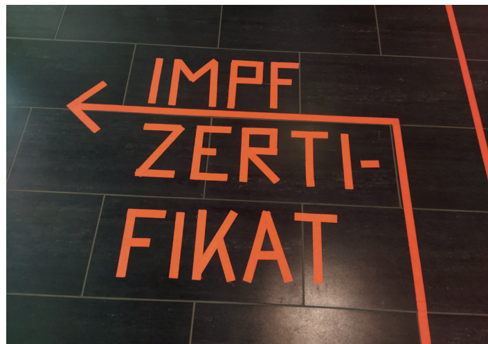
Im Perzina-Haus in der Wismarschen Straße 144 wird das digitale Impfzertifikat für vollständig im Schweriner Impfzentrum Geimpfte ausgestellt.

„Allein im Schweriner Impfzentrum wurden bisher mehr als 22.600 Bürgerinnen und Bürger vollständig geimpft“, berichtet Oberbürgermeister Rico Badenschier. „Mit der Ausgabestelle im Perzina-Haus schaffen wir ein Angebot, unkompliziert einen digitalen Impfnachweis zu erhalten.“ Impfmanagerin Monique Friske ergänzt: „Wir bieten diesen Service gut erreichbar in Zentrumsnähe mit umfangreichen Öffnungszeiten an. Auch an Samstagen hat die Ausgabestelle geöffnet.“