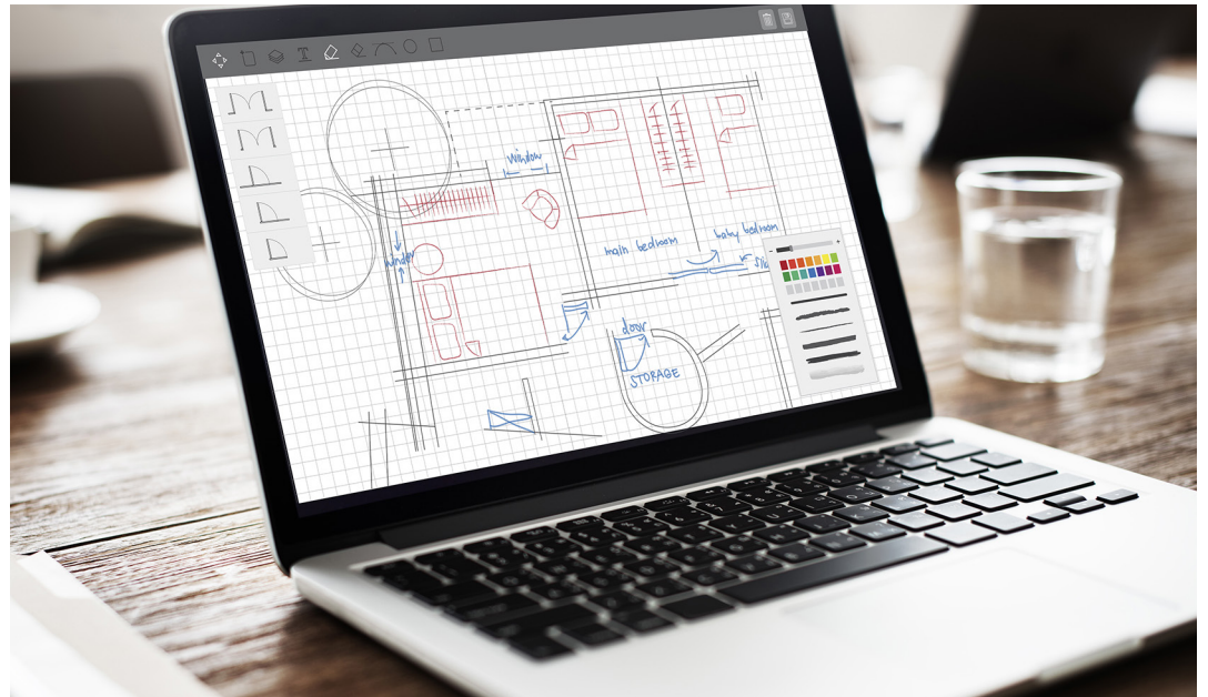
Die Bauaufsichtsbehörde der Landeshauptstadt Schwerin ermöglicht Bauanträge auch online zu stellen und das Baugenehmigungsverfahren gänzlich ohne Papier durchzuführen.

„Als besonders positiv wird in der Studie die gute Auffindbarkeit digitaler Verwaltungsdienstleistungen in unserem kommunalen Internetauftritt www.schwerin.de hervorgehoben. Im Teilbereich Bauen kann Schwerin insbesondere mit seinem noch