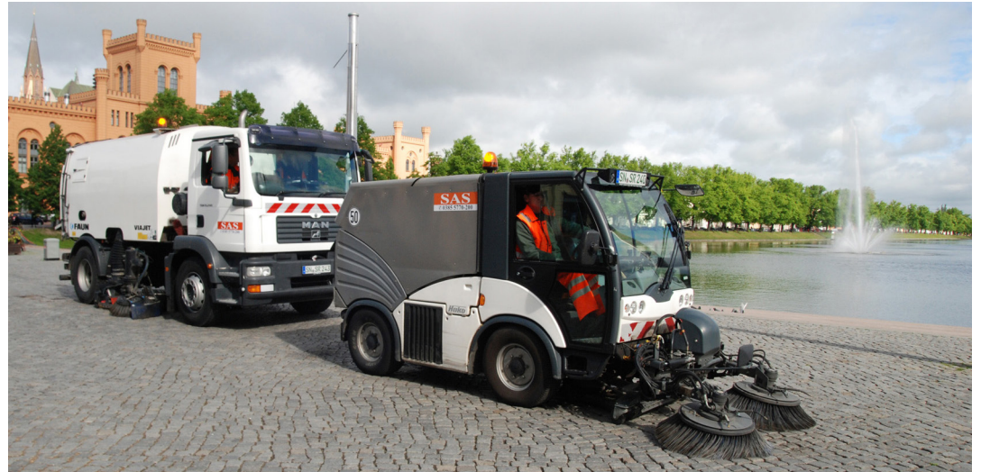
Das neue Straßenreinigungskonzept soll für mehr Transparenz und Beitragsgerechtigkeit sorgen.

„Schwerin hat sich in den vergangenen 20 Jahren vor allem durch das Entstehen neuer Wohngebiete stark verändert. Daher sind bei der Straßenreinigung ein paar Ungleichgewichte entstanden: Vergleichbare