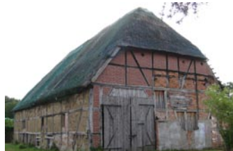
Diese denkmalgeschützte Scheune in Zippendorf steht zum Verkauf.