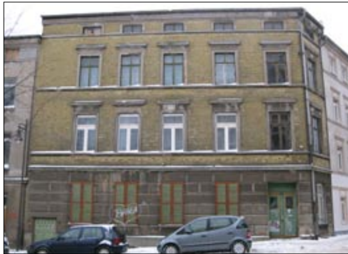
Soll verkauft werden: Diese Immobilie in der Gartenstraße steht zum Verkauf.

Das 184 m 2 große Grundstück Gartenstraße 4 ist mit einem dreigeschossigen, voll unterkellerten Mehrfamilienwohnhaus in traditioneller Bauweise bebaut. Das Dachgeschoss ist nicht ausgebaut. Die straßenseitige Fassade des Erdgeschosses ist mit Quaderputz versehen, die Fassade der Obergeschosse besteht aus Vorsatzklinkern. Die hofseitige Fassade ist geputzt. Das Gebäude hat ein flach geneigtes Satteldach mit Pappeindeckung. Das Gebäude wurde 1896 errichtet. Der bauliche Zustand ist mangelhaft. Wesentliche Baumängel