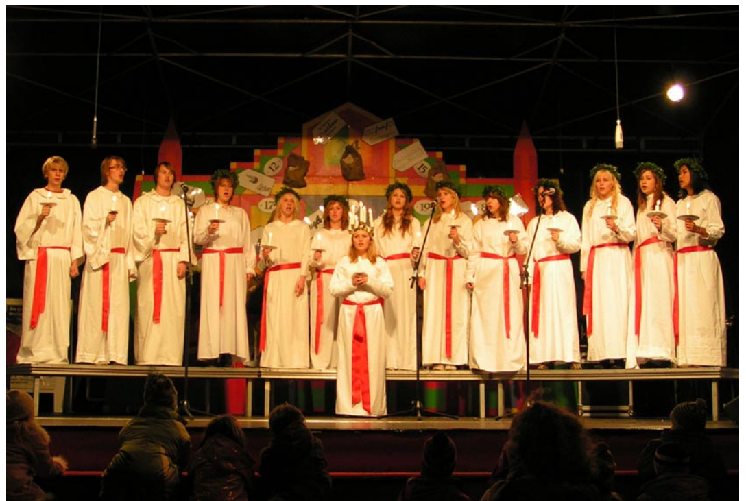
Am 5. Dezember auf der Bühne am Marktplatz zu erleben: die Lucia-Prozession aus Schwerins schwedischer Partnerstadt Växjö

Bis zum 30. Dezember, also länger als in den meisten anderen Orten, verwandelt sich die historische Altstadt Schwerins in eine weihnachtliche Bummelmeile mit zahlreichen Attraktionen. Auf dem Marktplatz erstrahlt eine 20 Meter hohe Tanne, geschmückt mit 10.000 Lichtern. Gleich nebenan auf der großen Bühne hat der Weihnachtsmann täglich um 16 Uhr in seiner „Sprechstunde“ ein offenes Ohr für die kleinsten Besucher. Hier werden auch Märchen vorgelesen, treten Bands auf oder Mitglieder der städtischen Kulturvereine. Auch Schwerins Partnerstädte präsentieren sich wieder auf dem Weihnachtsmarkt. So sind am 5. Dezember die traditionelle Lucia-Prozession sowie das schwedische Blasorchester aus Växjö zu erleben. Aus dem polnischen Pila reisen die Tanzgruppe und das Blasorchester für Auftritte am 19. und 20. Dezember an. Stimmungsvoll wird es mit der dänischen Hans-Christian-Ander-