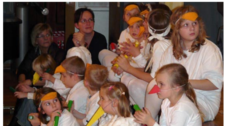
Schüler beim Weihnachtskonzert 2008

gemeinsam musizieren, werden sicher gern im Brigitte-Feldtmann-Saal vor größerem Publikum ihr Können zum Besten geben. Wer es etwas intimer mag und nicht gleich vor so vielen Zuhörern auftreten möchte, kann in einem der kleineren Räume singen oder spielen. Die Elternvertretung wird wie immer mit von der Partie sein und ihr köstliches Kuchenbuffet aufbauen. Der Eintritt ist frei. Um eine Spende für die zahlreichen Projekte der Musikschule wird gebeten.